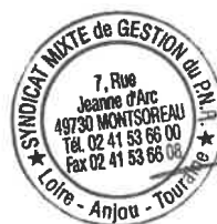
[Signature] Benoit BARANGER

Certifié exécutoire par le Président Compte- tenu de la transmission en Sous- préfecture et de la publication Le