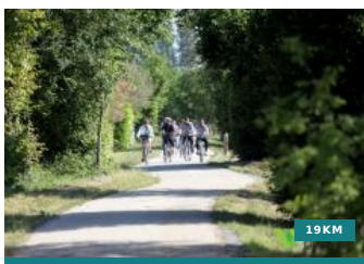
Voie verte Richelieu - Chinon