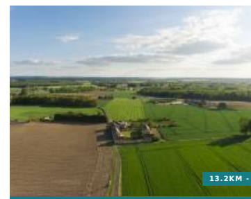
Entre Mâble et Veude - Circuit n°50