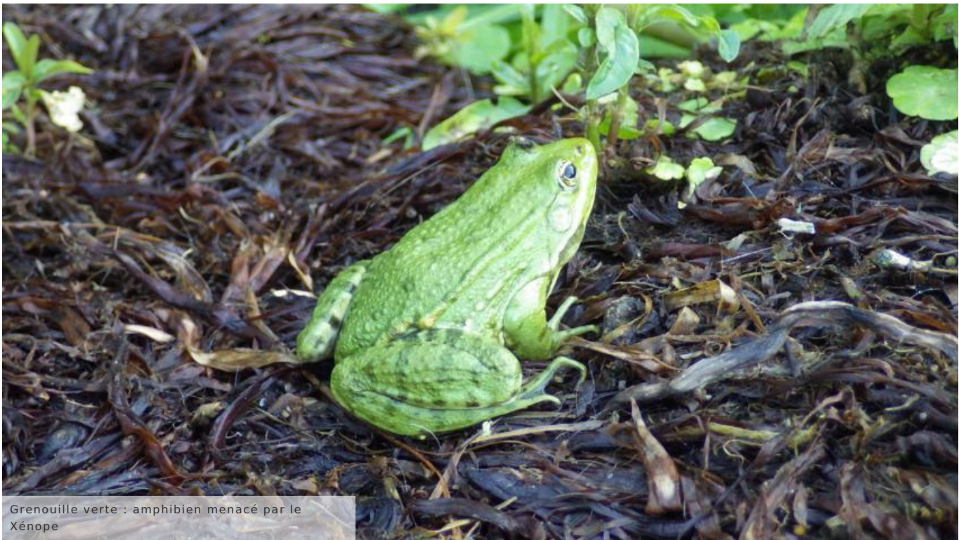
Grenouille verte : amphibien menacé par le Xénope