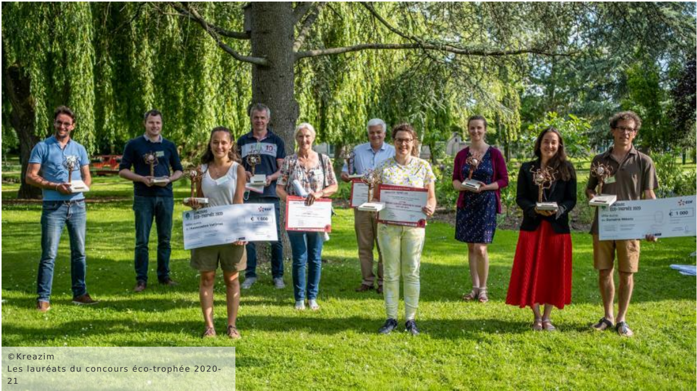
Les lauréats du concours éco-trophée 2020-21