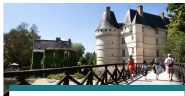
À l'ombre de romantiques châteaux et insolites troglos en vallée de l'Indre