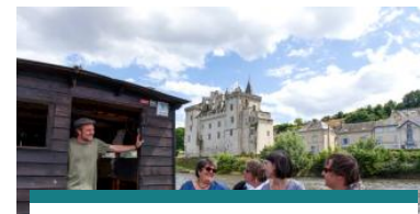
Les sorties accompagnées