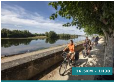
Au fil de l'eau - Circuit n°20