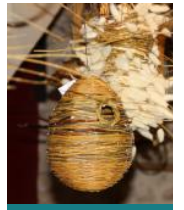
Plume et bri