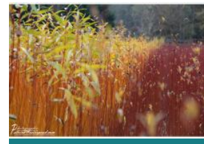
L'osier de Gué droit