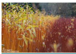
L'osier de Gué droit