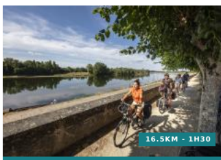
Au fil de l'eau - Circuit n°20