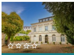
Le Grand Monarque