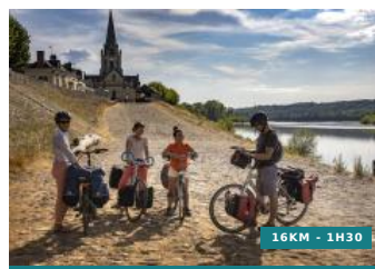
De port en port - Circuit n°19