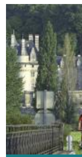
La belle au Bois n°21