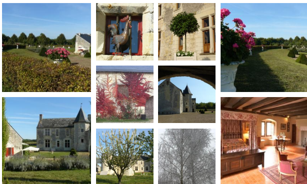
Table d'hôte : 50€