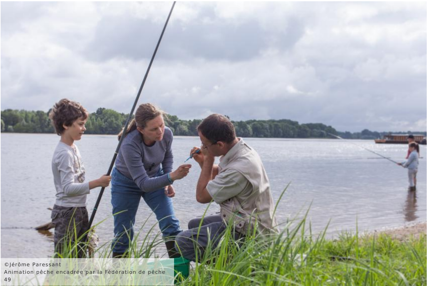
© Jérôme Paessant Animation pêche encadrée par la Fédération de pêche 49